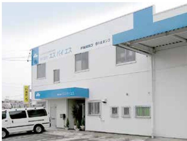
静岡、富士、浜松の3拠点体制で 静岡県全域をカバーし、事業を展開しています

設立時に目指したのは、社員が働きやすく、笑顔が絶えない明るい職場です。その目標を実現するため、休暇制度の充実にも努めています。