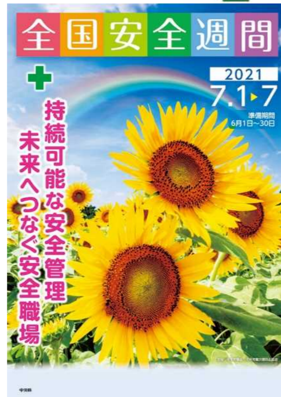
中災防 全国安全週間ポスター

いったん労働災害が発生すれば、被災された労働者やそのご家族が辛い思いをするのみならず、事業活動にも大きな影響が生じます。 労使が一体 となり、 新型コロナウイルス感染症に対する基本的な感染防止対策を徹底 するとともに、 将来を見据えた持続可能な安全管理 に取り組んでいきましょう。